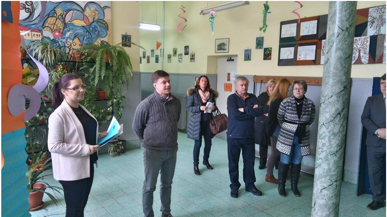
Opstinsko takmičenje iz fizike 19.02. 2017.