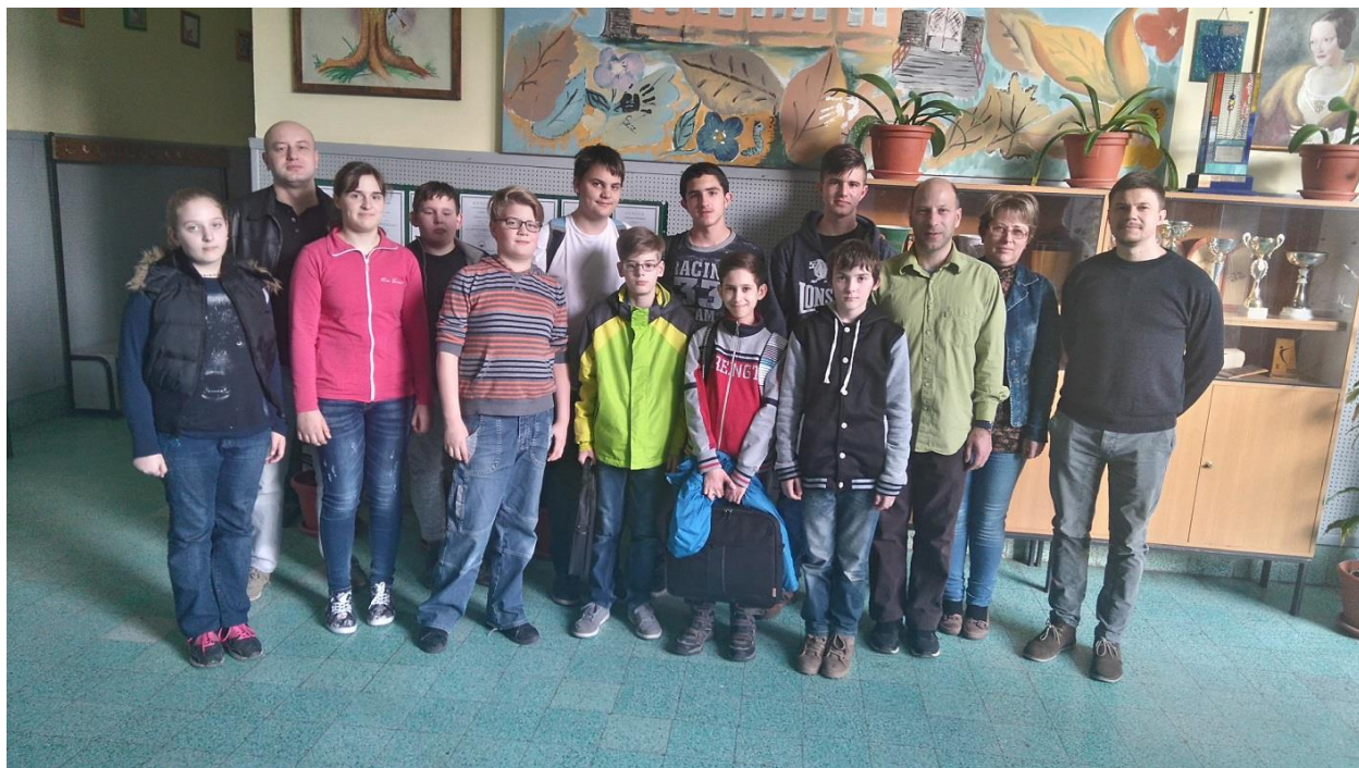
Opštinsko takmičenje iz informatike 04. 03. 2017.