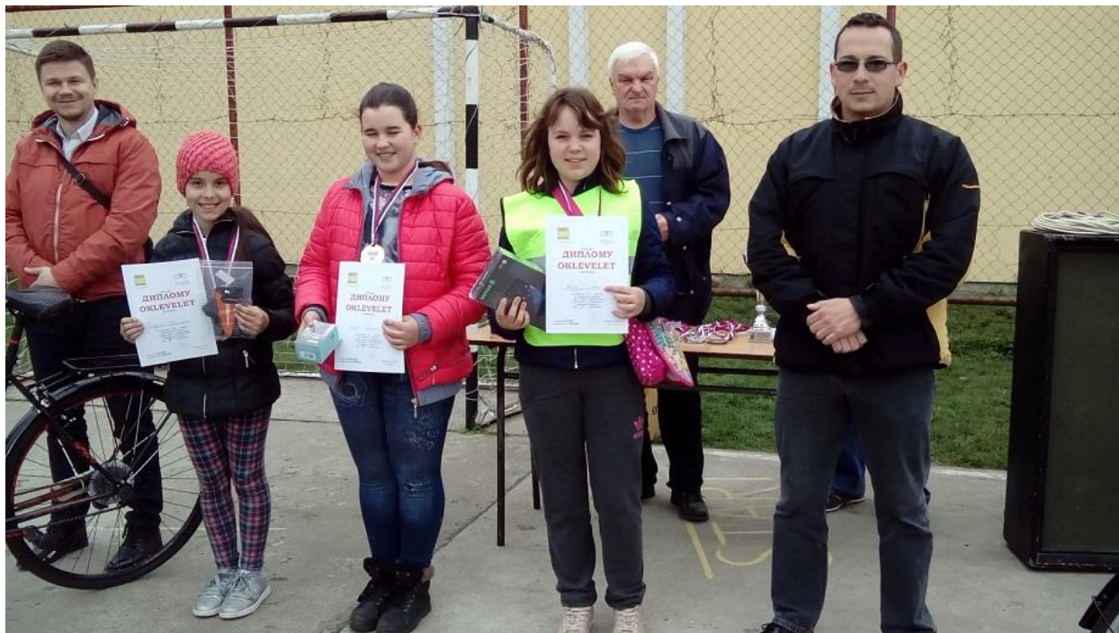
Okružna smotra „Šta znas o saobraćaju” 22.04. 2017.